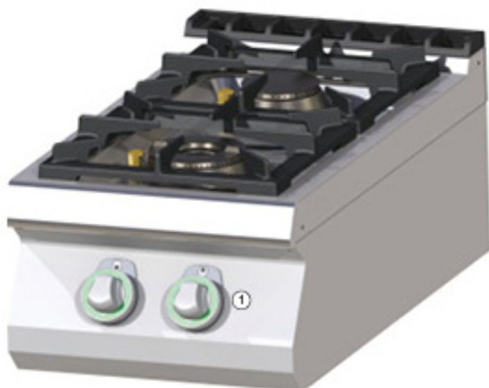
① Bouton de commande